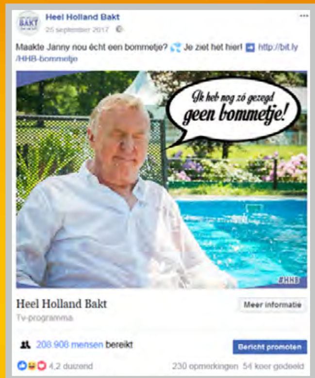
Fans van Heel Holland Bakt krijgen een uniek kijkje achter de schermen.