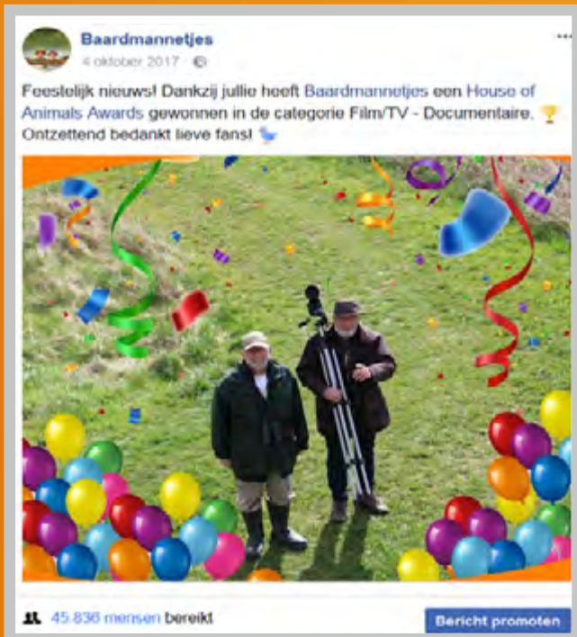
Fans worden bedankt voor hun betrokkenheid

De Heel Holland Bakt-app zit boordevol verrukkelijke recepten, maar beschikt over veel meer ingrediënten. Zoals een HHB-kookwekker, waardoor je nooit meer een baksel vergeet of aan laat branden. Trotse bakkers kunnen hun bakfoto's voorzien van HHB-frames en vervolgens delen met anderen (waardering van 4,1).