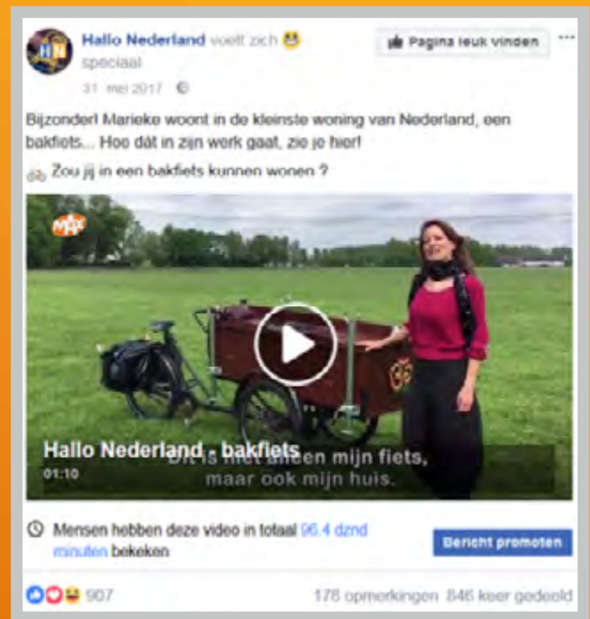
Ondanks de zomerstop op tv blijft Hallo Nederland via sociale media mooie verhalen brengen.