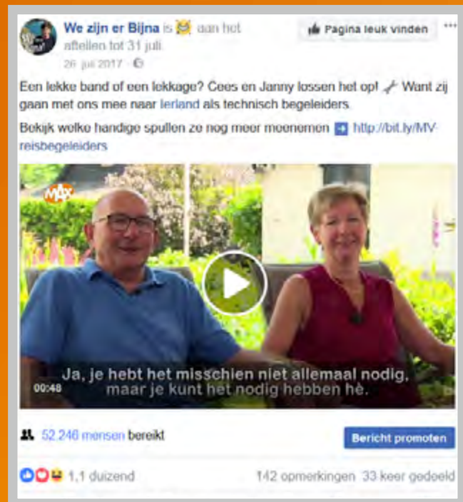
Vorstelfilmpjes van de reisbegeleiders We zijn er Bijna!