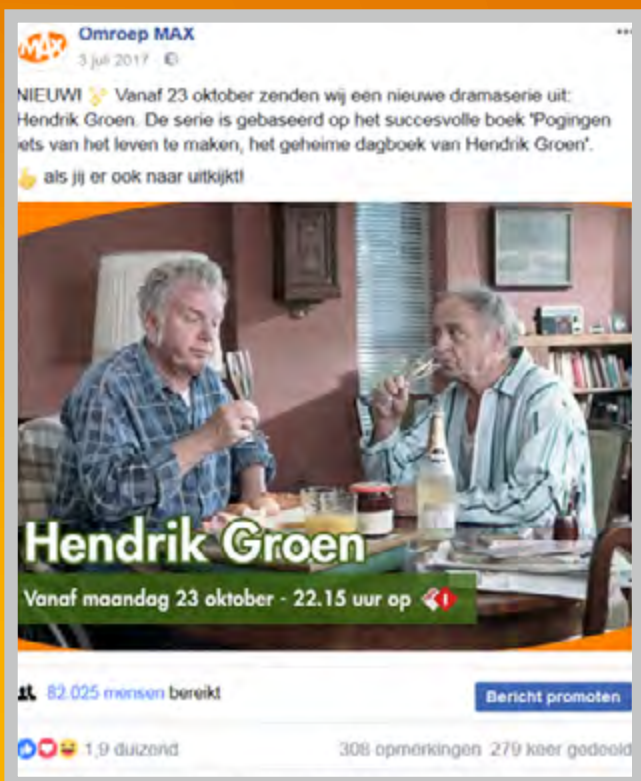
Via sociale media brengen we fans op de hoogte van nieuwe programma's