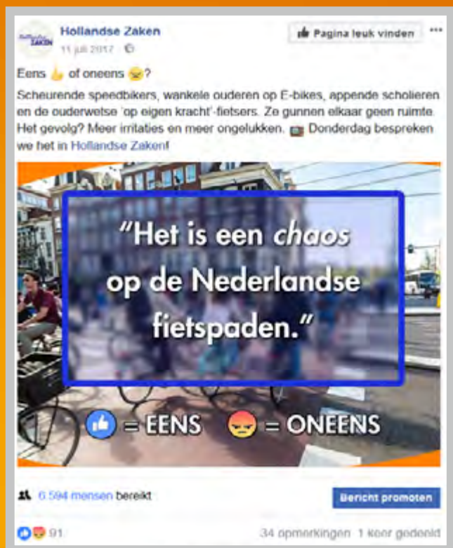
Debat wordt alvast op sociale media gevoerd.