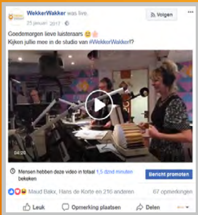
Radio wordt visueel als fans mee kunnen kijken in de studio via Facebook.